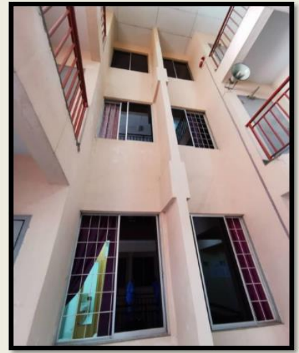
Bilik Kuarantin Keluarga